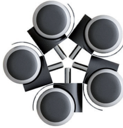
1.2. Прорезиненные ролики (5 шт)