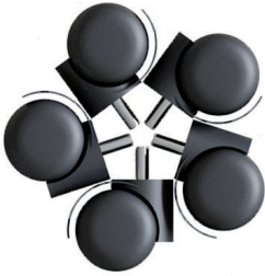
1.1. Ролики (5 шт)