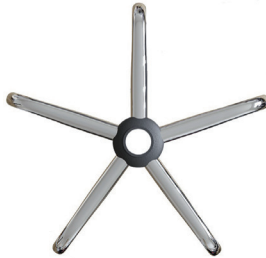
2.2. Хромированная крестовина (1 шт)