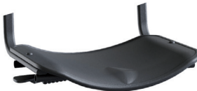
5. Сиденье в сборе (1 шт)