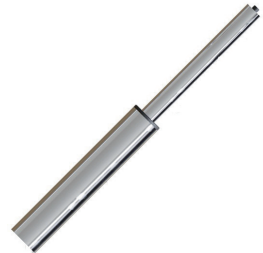
3. Газлифт низкий или высокий (1 шт)