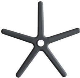
2.1. Пластиковая крестовина (1 шт)