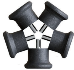
1.3. Стационарные опоры (5 шт)